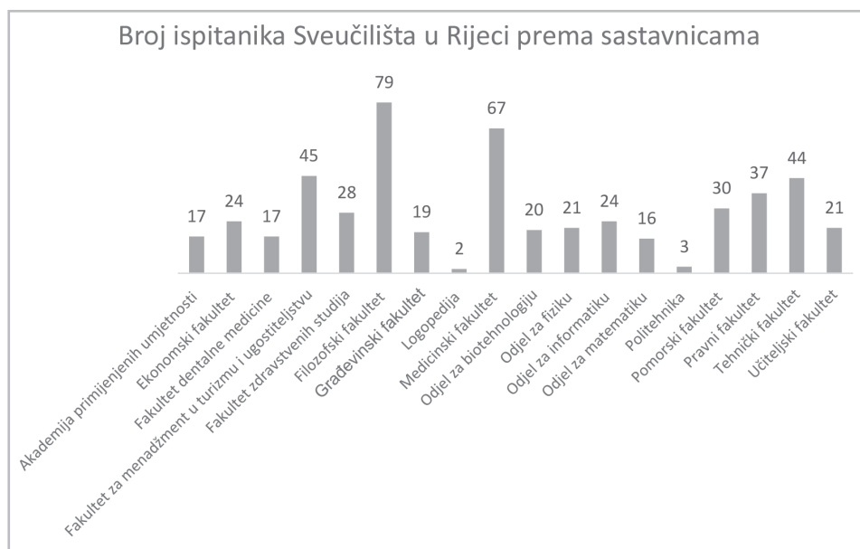
Slika 1. Broj ispitanika Sveučilišta u Rijeci prema sastavnicama Sveučilišta

Ispitanici zaposleni na Sveučilištu u Rijeci mogli su izabrati sastavnicu na kojoj rade. Rezultati su prikazani na slici 1.